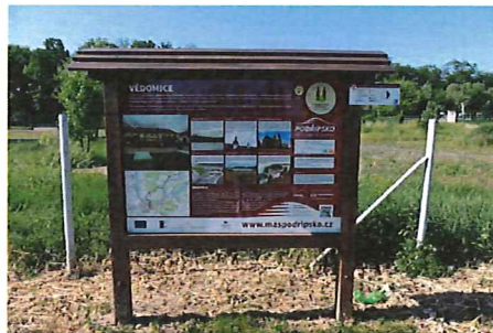
Podél Polabské stezky se na dvanácti informačních tabulích dozvíte o zajímavostech v okolí.