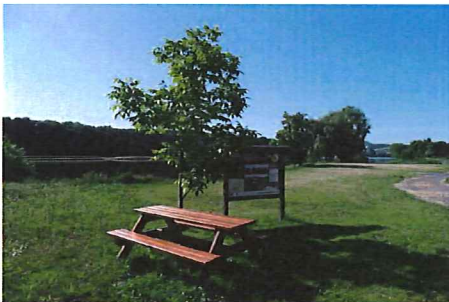
Jedno z deseti odpočivných míst se nachází v obci Kyškovice na pravém břehu řeky Labe.

K vinařské tematice neodmyslitelně patří degustace vín. Na ochutnávku ryze českých vín z produkce malovinařů mělnické a litoměřické vinařské podoblasti láká akce Roudnický košť každý rok přes tisíc návštěvníků a producenti vína dokazují milovníkům tohoto moku, že i v Čechách se vyrábí velice kvalitní a zajímavá vína. Během košty probíhá vždy anketa o titul Vinaře Roudnického košty. O vítězi rozhodují samotní návštěvníci akce prostřednictvím hlasovacího kupónu.