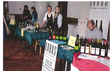
Na Roudnickém koštu se každoročně představí desítky vinařů z mělnické a litoměřické vinařské oblasti.